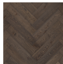
Segno Oak Old Brown

Obrázky jsou pouze ilustrativní. Pro více informací o vzhledu a variacích si prohlédněte Grading Book nebo www.tarkett.cz . Mezinárodní sortiment materiálů společnosti Tarkett se skládá z mnoha rozdílných produktů. Dostupnost v jednotlivých zemích se může lišit. Přestože jsme se snažili reprodukovat fotografie tak, aby reflektovaly konečný produkt, kvalita monitoru nebo tiskárny a přirozenost dřeva může mít za následek rozdíly v barvě a struktuře jednotlivých lamel.