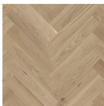
Segno Oak Blonde