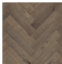
Segno Oak Old Grey